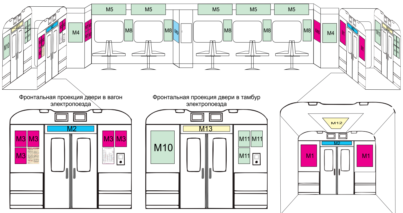
Схема распределения рекламных зон в вагоне пригородного электропоезда

ВНИМАНИЕ! К размещению принимаются материалы только на самоклеющейся пленке. Если стикер имеет нестандартный размер, расчет стоимости размещения производится по занимаемой площади, исходя из стоимости см 2 .